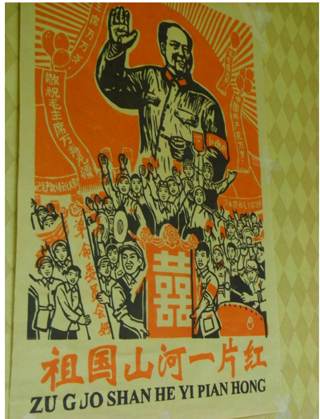
此乃本委员会场内的大字报

汪东兴（由薄一波的扮演者，也就是我，扮演）以及张春桥（由邓小平的扮演者扮演）接替了之前薄一波与邓小平在政治局中的席位。政治局决定以武器装备的形式援助北越，并且动员集结在北部边境的军队前往南部边境。政治局否决了由刘少奇和张春桥起草的两封外交信函，其中刘少奇与张春桥起草的信函都是发往美国的。