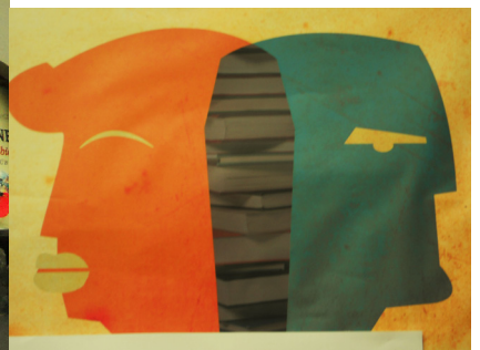
▼ 南山 海报