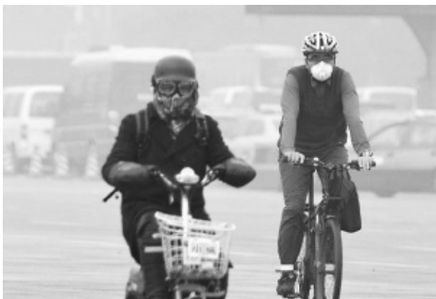
图为戴“防毒面具”上街的北京市民

在中国，灰霾天气最严重的无疑是北京。“第一天到建国门这边上班，出了地铁口，我还可以看到北京站东侧约300米的北京同济医院，第二天，却连近在咫尺的“北京站”三个字都模糊起来，更别提什么北京同济医院了。”这是一位北京市民的说法，也是北京如今灰霾现象的真实写照。“明天就像盒子里的巧克力，你永远