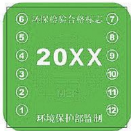
绿色环保检验合格标志样式

再说，黄绿标的办理的手续可说极为简单。一是车主无须开车到现场，仅凭机动车行驶证和车辆信息即可办理，二是免费，且是系统根据行驶证上的车辆信息自动生成。不过办理黄绿标办理的前提是有排污证，办证免费，但其中的环保评估需付费，不久前从30元/次涨到了60元/次。当然，黄绿标是有期限的。过期了就得重办。