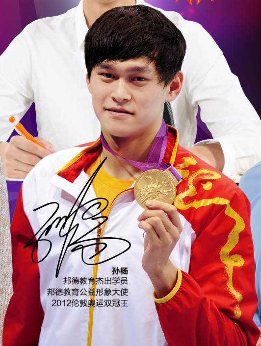
孙杨 邦德教育杰出学员 邦德教育公益形象大使 2012伦敦奥运双冠王