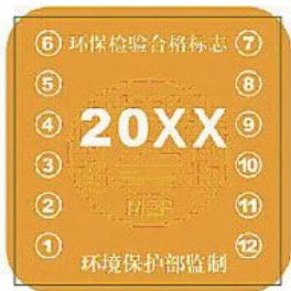
黄色环保检验合格标志样式