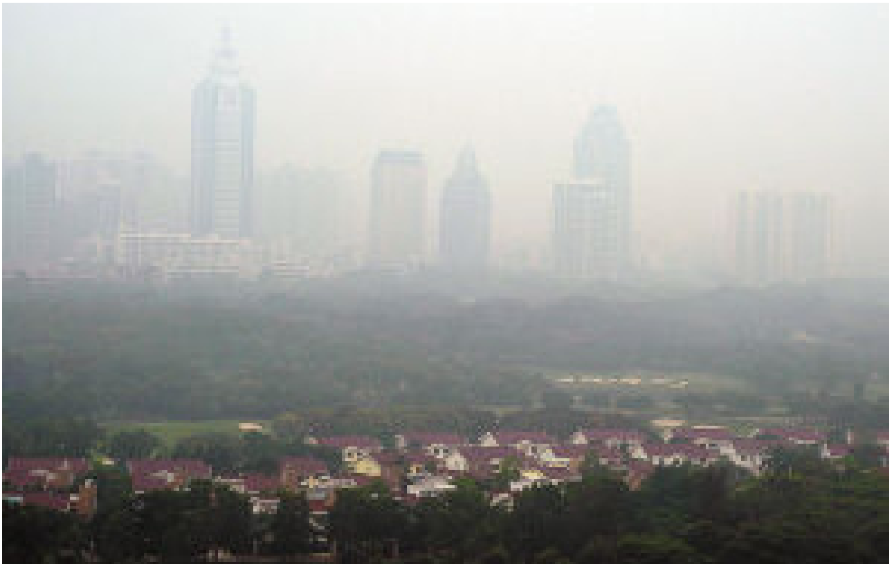
图为阴霾中的深圳。发现自己生活在这样的城市里的你，有没有下意识屏住呼吸呢？

少不了。清扫路面的车每天一冲，可是冲地面时反而把灰尘都激起来，有时候一趟车过去遮天蔽日的。”老先生说了几句之后还有点忿忿不平，“最近天还蓝点儿了，前两年那灰突突的，晚上的一颗星星也看不见。听说是因为要搞大运会，为了给外国人看的，才好好整治了几下。有那本事怎么不早整治呢，这东西伤的是咱自己人。”