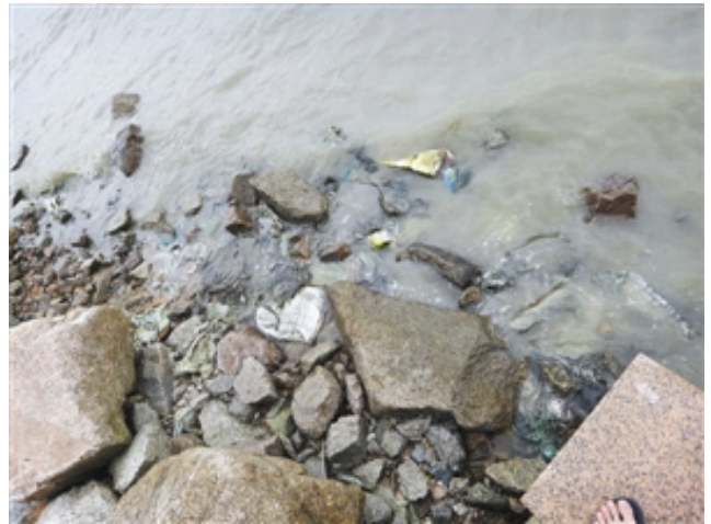
图为深圳湾的河边，水质污浊的近乎不透明。

让我们将目光转向福建省，当地于 2008 年开展了海洋环境综合整治，通过加强对海湾的水质检测、加强对涉海项目工程的监测、协调好海域网箱养殖以及开展海漂垃圾治理，以达成一个与“绿地蓝天”相匹配的“碧海”的目标。