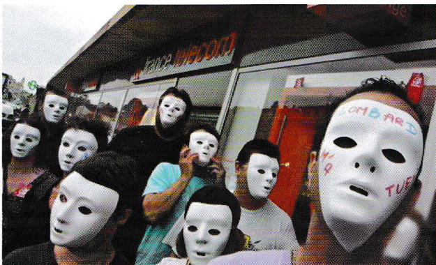
图为法国电信员工对该公司发生的系列自杀事件表示不满

2010年，富士康连续有14名员工跳楼，它由此背上了“血汗工厂”骂名；这一年，美国康奈尔大学也因6人连续自杀备受困扰；富士康自杀潮的前一年，华为公司同样出现了自杀潮。自杀传染性表现最强烈的当属法国电信，2008年有24人自杀。