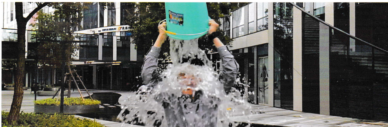
图片来自于互联网

从科里·格里芬的第一桶冰水开始，这个夏季无数桶冰水洒遍了全球各地，穿越各个领域。人们为之欢呼盛赞，许多人疯狂着，快乐着，而在这片“盛景”的背后，我认为我们应该给冰桶挑战一个放大镜——在看似光鲜的表面下，发现冰桶挑战客观真实的样子，看看中国的公益又将行向何方。