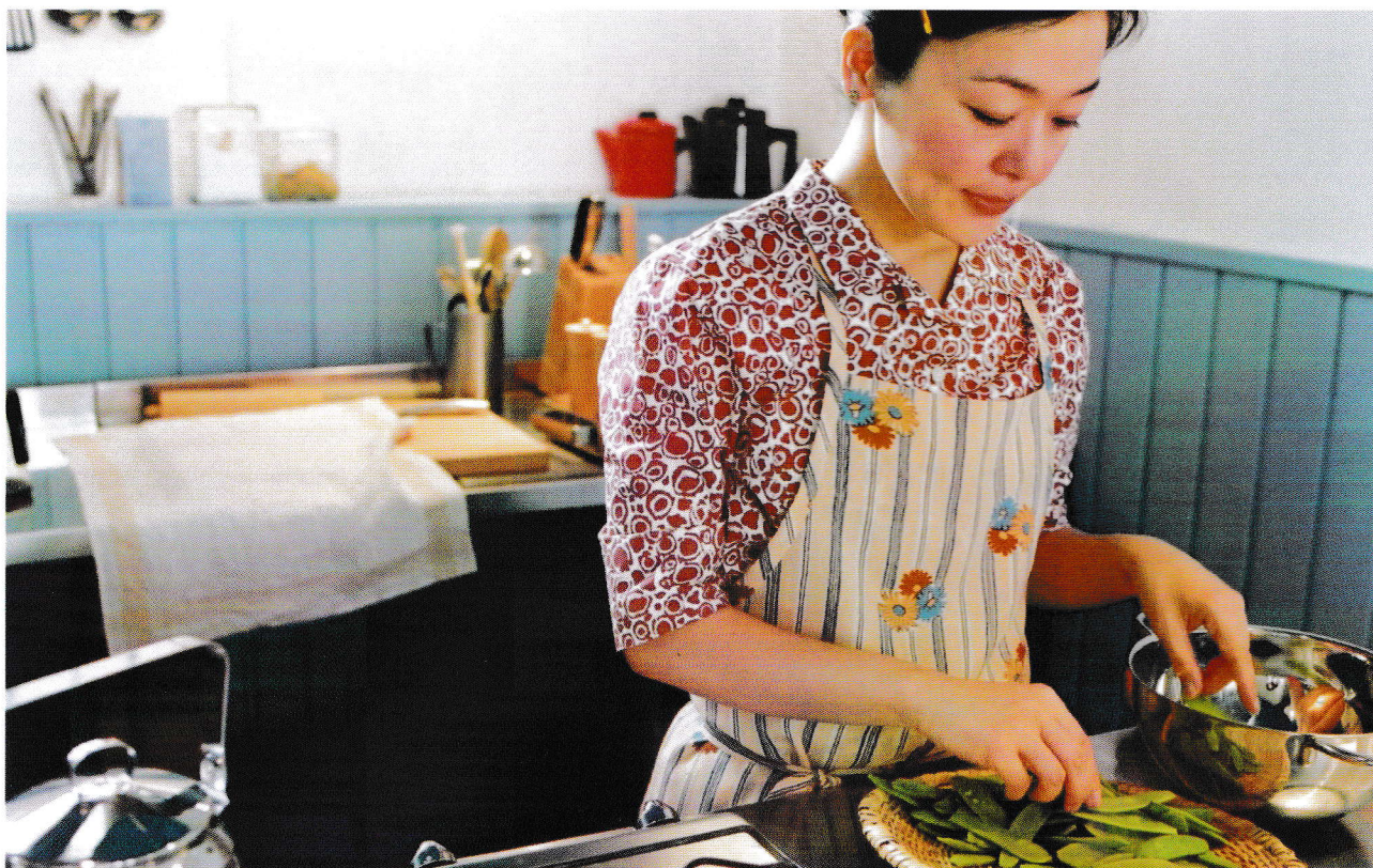
图为海鸥食堂剧照

何况是在这样一家古怪的异国餐厅呢。幸慧总是想让自己做的菜品更加美味，而一个芬兰男人教她磨出了世界上最好喝的咖啡，并用手指了指心脏。