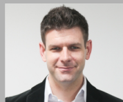
Ross 多伦多大学全球事务 芒克学院国际关系硕士