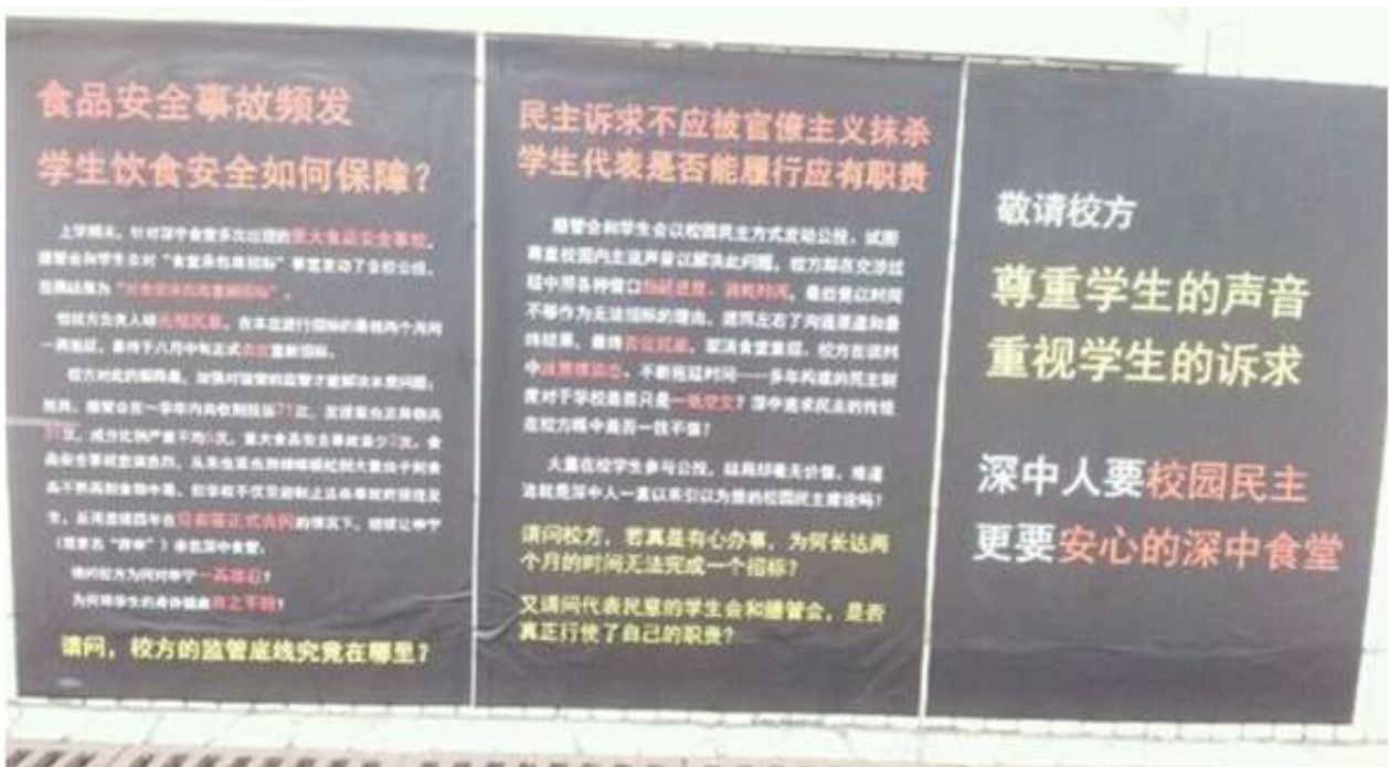
图片来源于网络，现已被其他海报覆盖。